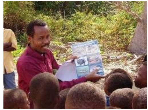
Campagne de conservation des tortues marines sur l'île d'Anjouan aux Comores

C3 mobilise directement les communautés vivants sur ces îles ; écoles, universités, gouvernements et entreprises publiques pour assurer que des objectifs préalablement définies soient atteints. Sans ordinateurs pour mettre en place des campagnes de prévention et communiquer en temps réel via Internet avec les autres filiales de l'ONG C3 serait dans l'impossibilité d'opérer. Un chargement d'ordinateurs vient de quitter l'atelier de Computer Aid à Londres direction les bureaux de C3 aux Comores. Ces ordinateurs vont permettre l'ouverture d'un centre d'information interactif.