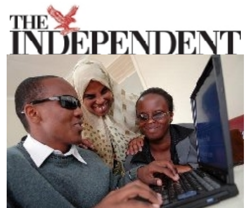
Etudiant malvoyant utilisant un ordinateur équipé d'un logiciel pour malvoyants fournis par Computer Aid, Kenya